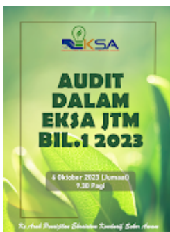
Poster Audit 6 Oktober 2023 edited.png 4971K

Pengguna Perkhidmatan MyGovUC 2.0 adalah bertanggungjawab melindungi kerahsiaan data/maklumat Rahsia Rasmi Kerajaan. Adalah diingatkan agar pengguna sentiasa peka dengan SEMUA peraturan, arahan keselamatan dan pekeliling semasa yang berkuatkuasa bagi semua pengendalian data/maklumat Rahsia Rasmi Kerajaan yang berkaitan.