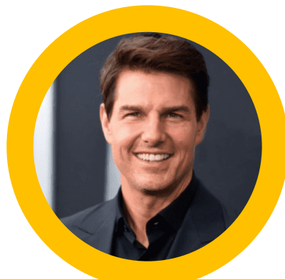
NAMA KETUA PENOLONG PENGARAH DV48