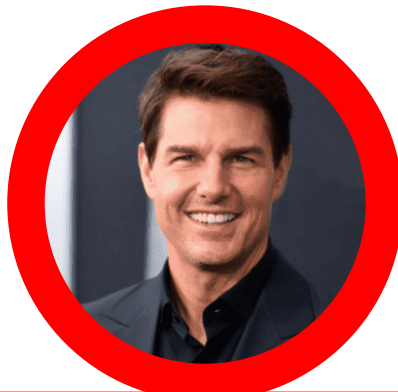
NAMA KETUA PENOLONG PENGARAH DV48