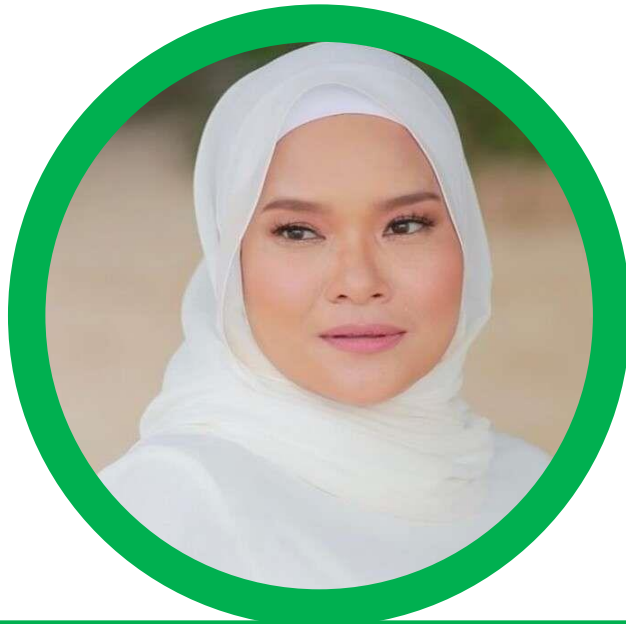
NAMA PENGARAH PENGARAH DV54