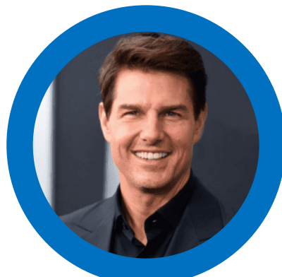
NAMA KETUA PENOLONG PENGARAH DV48