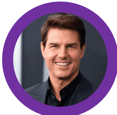
NAMA KETUA PENOLONG PENGARAH DV48