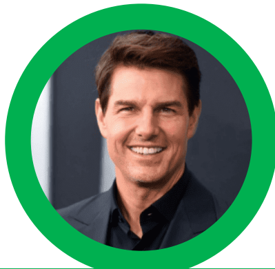
NAMA KETUA PENOLONG PENGARAH DV48