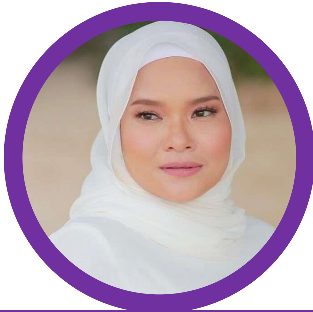
NAMA PENGARAH PENGARAH DV54