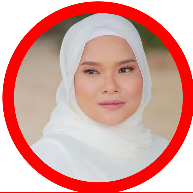
NAMA PENGARAH PENGARAH DV54