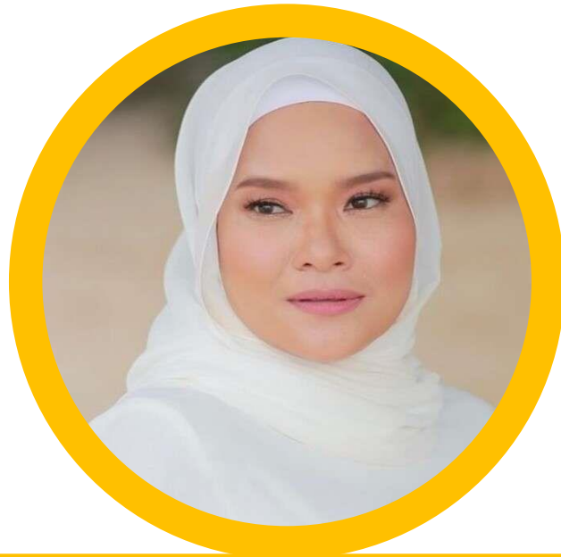
NAMA PENGARAH PENGARAH DV54