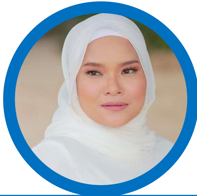
NAMA PENGARAH PENGARAH DV54